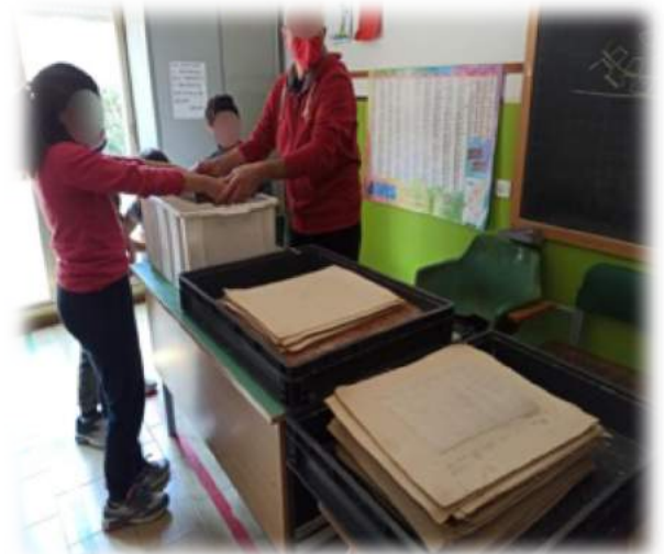
3. Immersione del telaio nella vasca