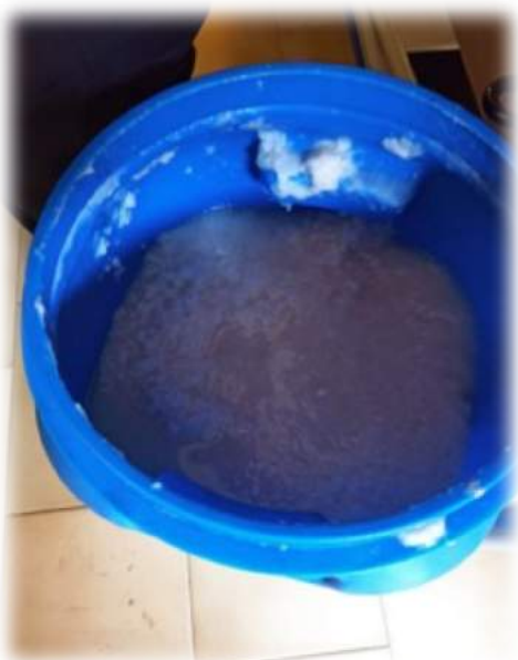
1. Miscuglio di acqua e cellulosa ottenuta dallo sminuzzamento di magliette di cotone.

... abbiamo seguito il laboratorio SESA «Dagli stracci alla carta» le cui fasi sono state diverse.