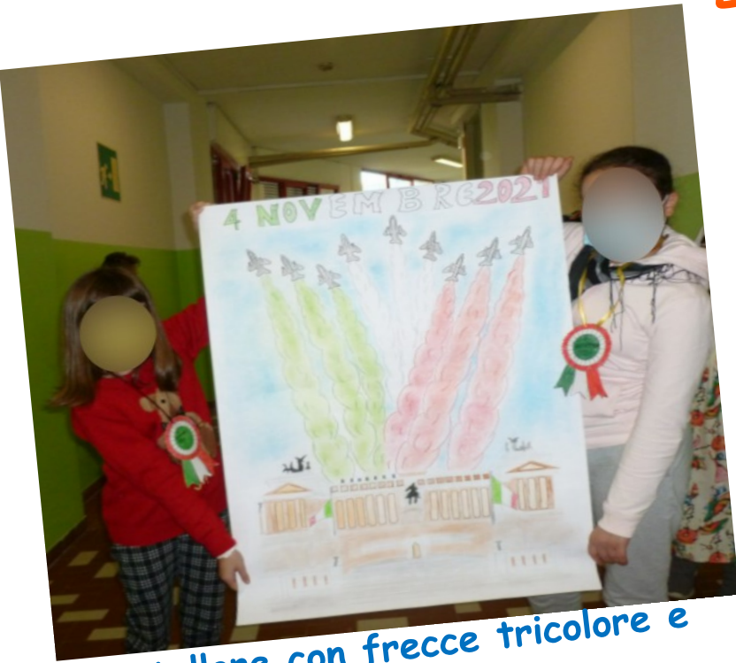
Cartellone con frecce tricolore e altare della Patria