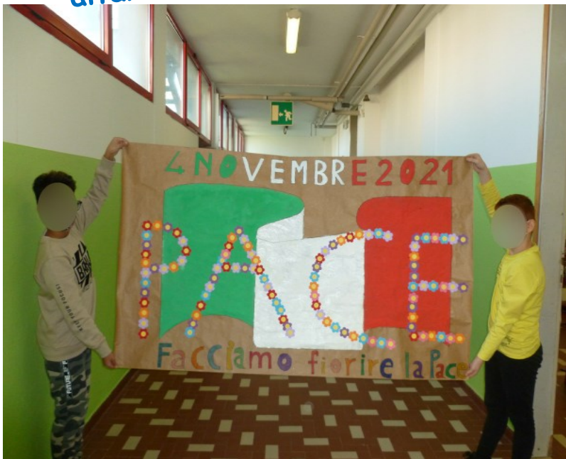
Cartellone con il tricolore e la parola PACE