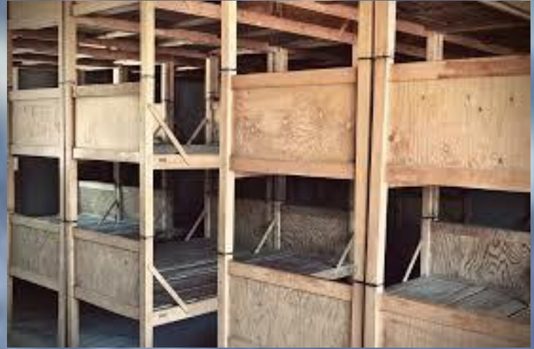
Ricostruzione dei letti