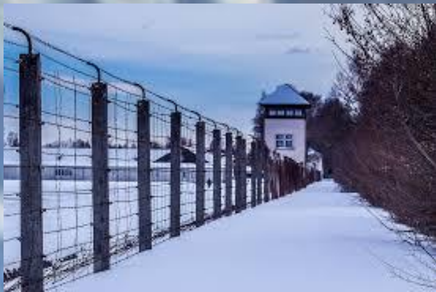
Recinzione per impedire le fughe