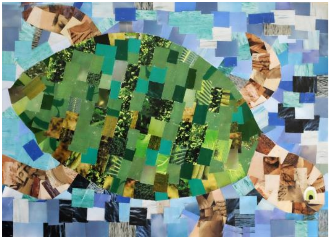
Collage di carta