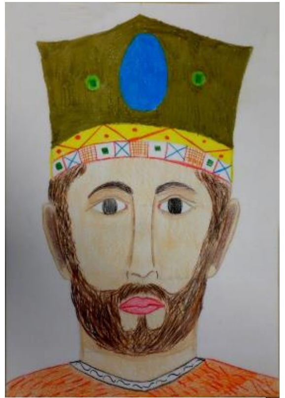
Volto del re