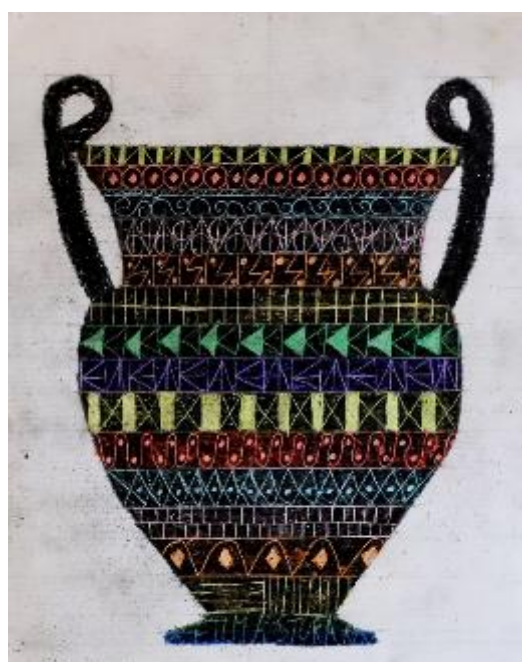
Vaso greco GRAFFITO SU CERA