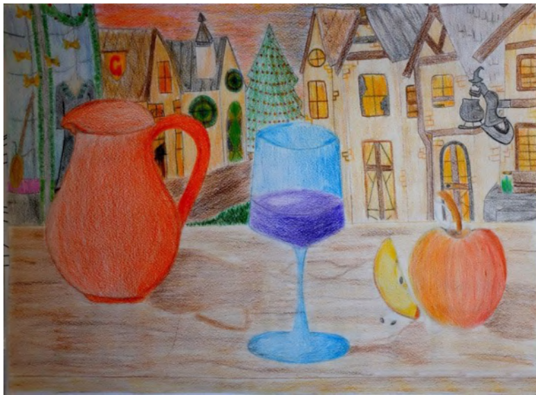
Composizione di oggetti