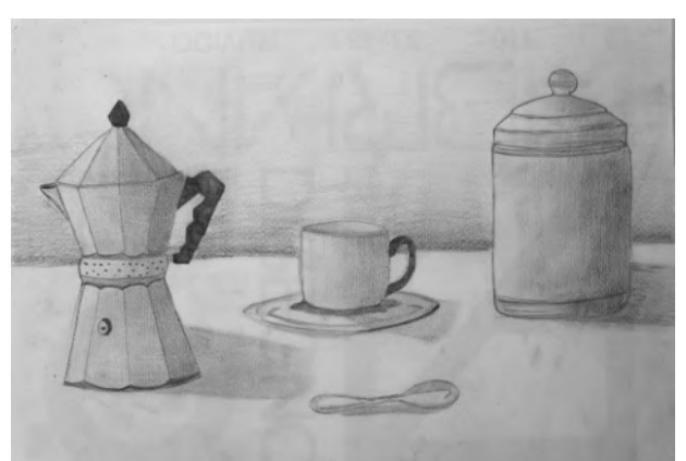
Esercizio sulle ombre