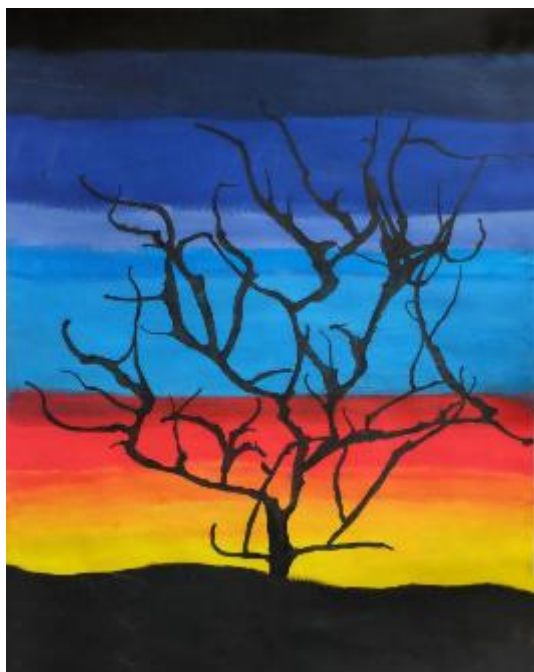
Albero con CHINA SOFFIATA

Attività prodotte dagli alunni delle classi PRIME (corso B-C-D)