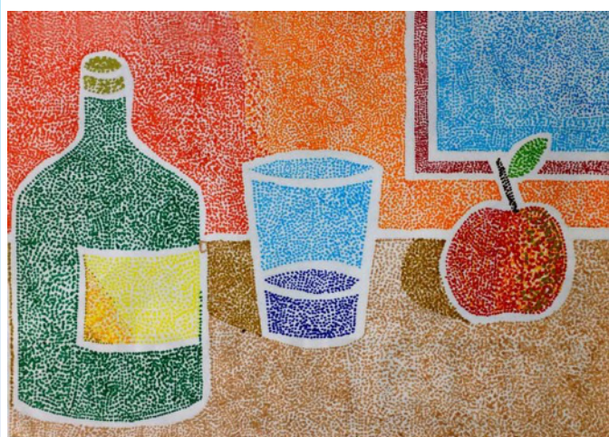
Punti a pennarello