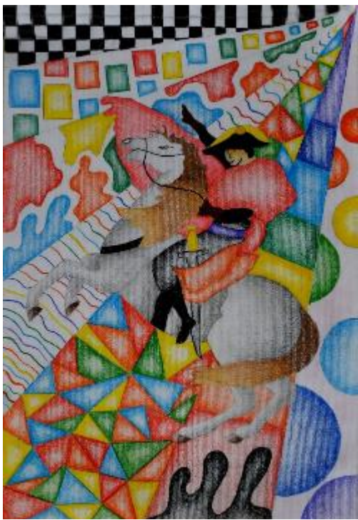
Napoleone di JL DAVID