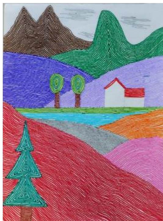
Linee a pennarello