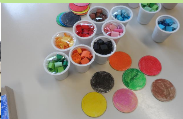
REALIZZAZIONE DI UN MEMORY DEI COLORI USANDO MATERIALI DI RECUPERO