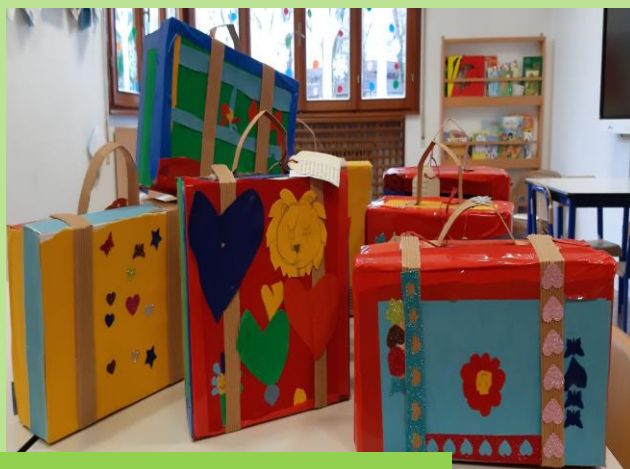
COSTRUZIONE DI VALIGIE CHE POSSANO CONTENERE I LIBRI REALIZZATI DA NOI